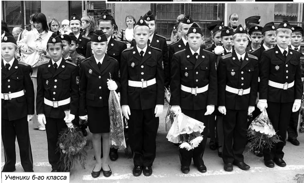
Ученики 6-го класса

отмечают в родном школьном дворе. Уже в будущем году многие будут встречать 1 сентября в стенах вузов и техникумов. Именно им, самым «старшим по званию школьниками», по традиции предоставили право вручать кадетские погоны главным участникам торжества: первоклассникам.