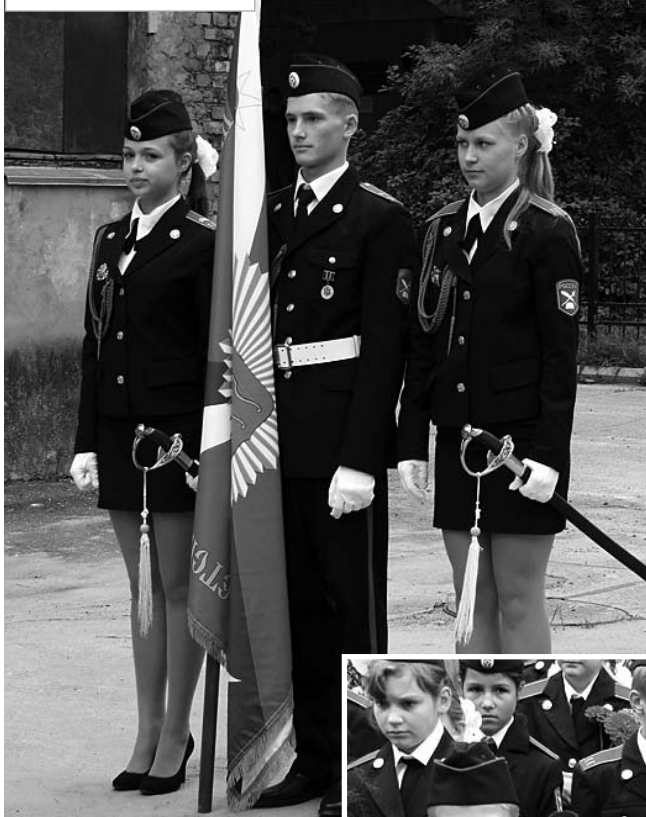
Торжественный вынос знамени

лась праздничная школьная линейка. Гимн Российской Федерации и торжественное поднятие флага, клятвенные обещания школьников «не лениться, а только хорошо учиться» и вручение первоклассникам новеньких кадетских погон - таковы основные моменты праздника.