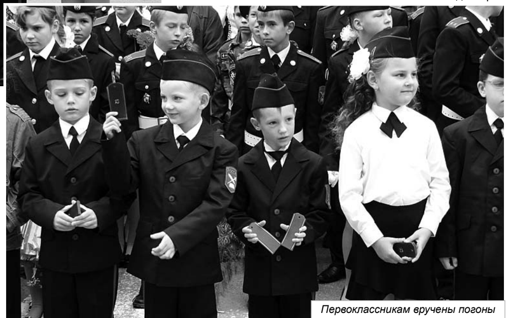
Первоклассникам вручены погоны

А молодое поколение, сегодняшние одиннадцатиклассники, едва могли сдержать слезы, ведь этот День Знаний они в последний раз