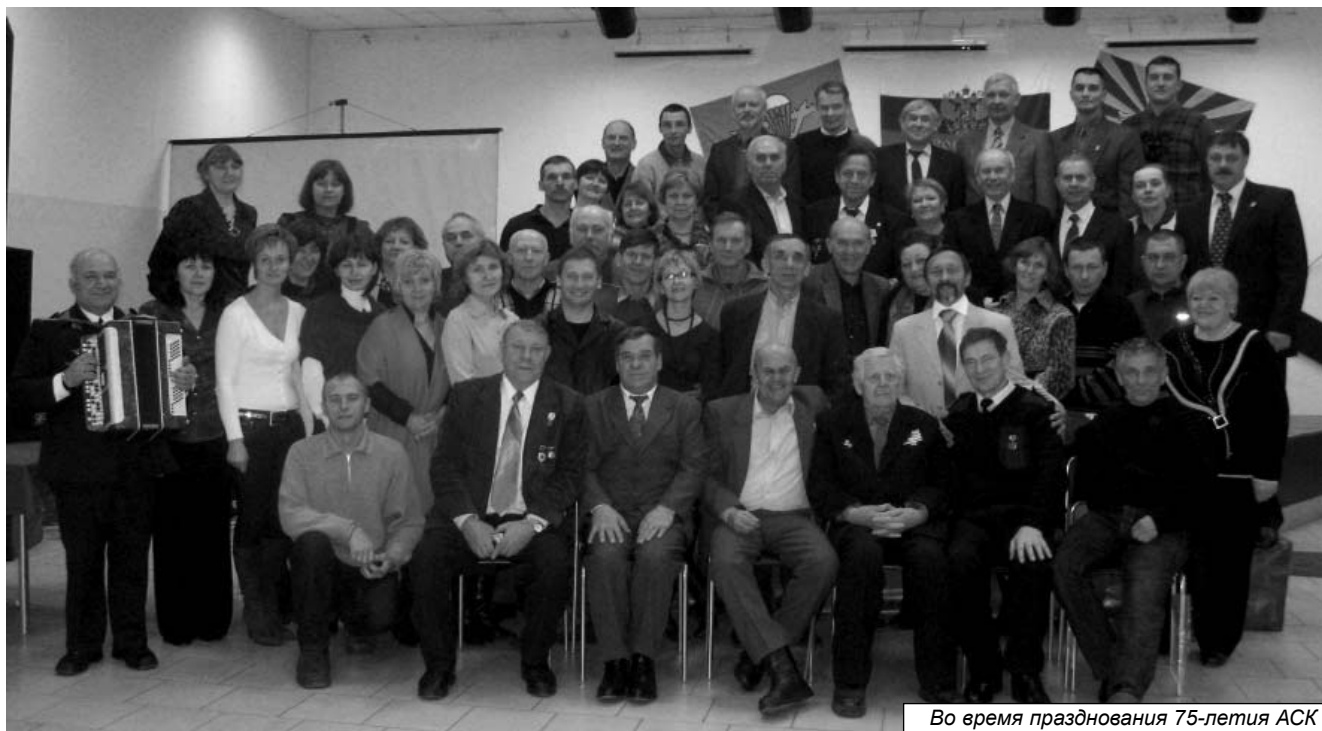
Во время празднования 75-летия АСК

тия реальной авиацией. Так выстраивается система патриотического воспитания, а без системы мы постоянно