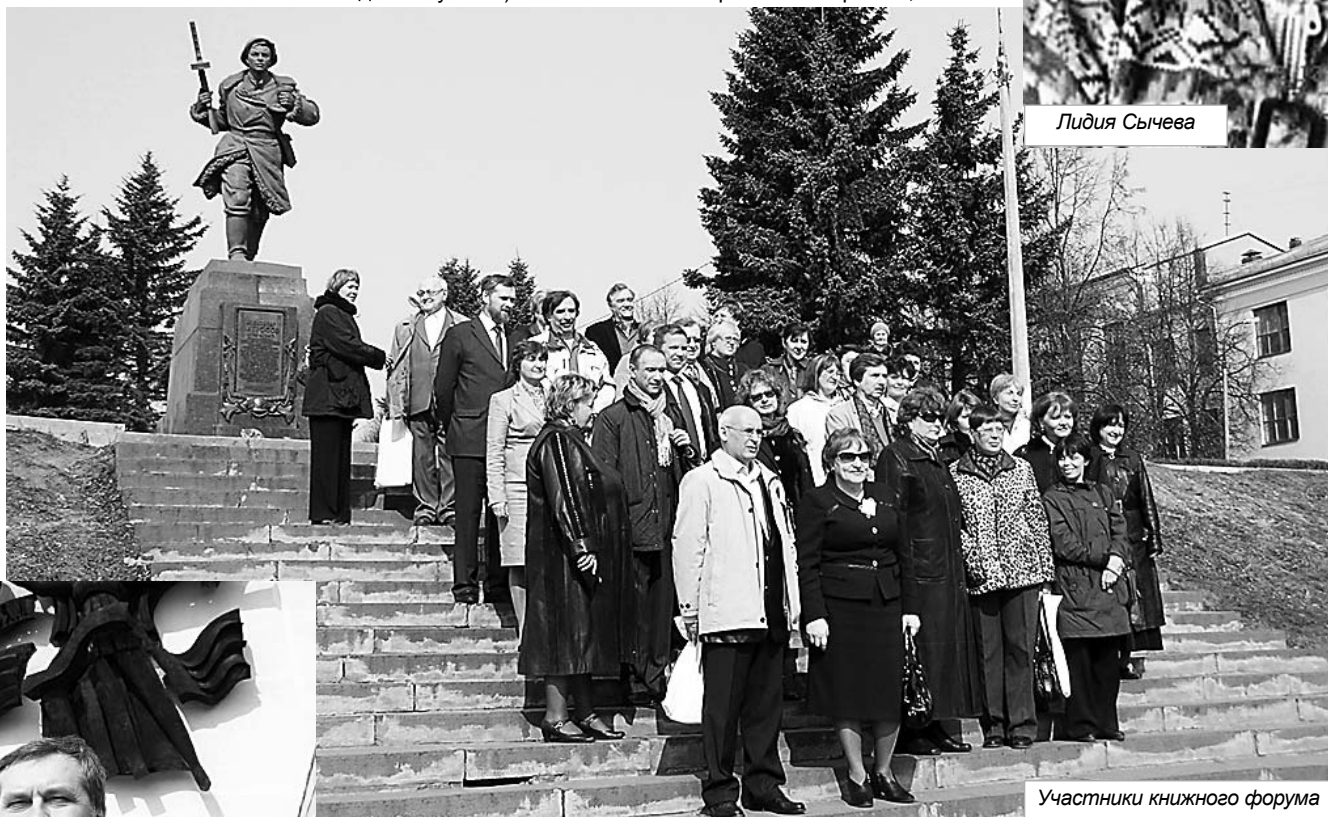
Участники книжного форума

Вообще, в этой поездке все было хорошо, удачно – начиная от погоды и заканчивая знакомствами, но почему-то в целом путешествие оставило грустное чувство.