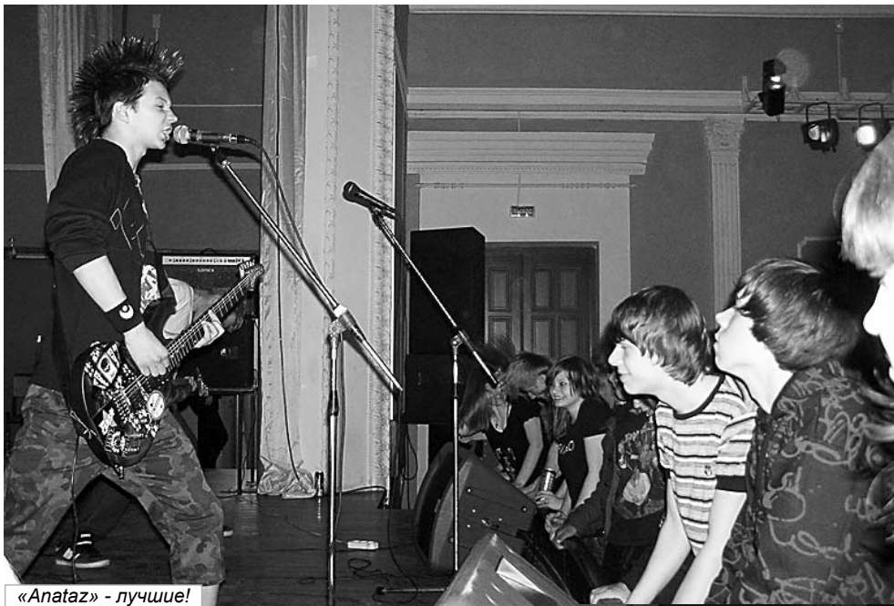
«Anataz» - лучшие!

Все эти песни реально в своё время были больше, чем просто песни. Их реально любили и всерьёз пели. Самое, наверное, яркое исполнение летовского гимна «Всё идёт по плану» я слышал не в навороченных залах, а в псков-