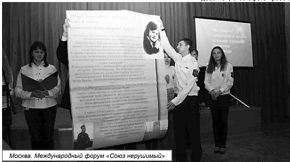
Москва. Международный форум «Союз нерушимый»