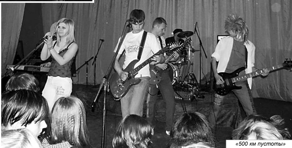
«500 км пустоты»

А вот дальше началось уже преинтереснейшее занятие: