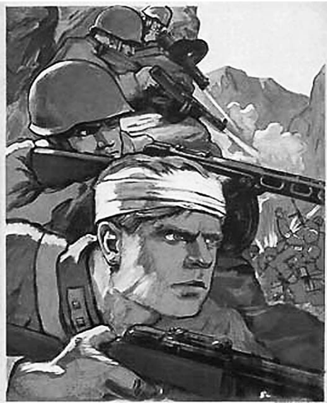
КАЖДЫЙ РУБЕЖ — РЕШАЮЩИЙ!

Можно сказать, что та же самая войны унесла и жизнь отчима моего отца. У него с детства был туберкулез кости левой ноги. Поэтому он сильно хромал, но на войну забрали и его, правда, лишь в сорок третьем году. А через восемь месяцев он получил