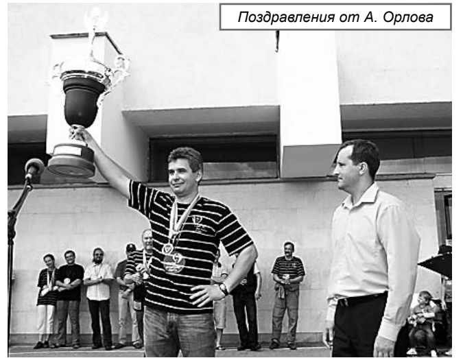
Поздравления от А. Орлова

И не только её. Всего победителей 48. Кто-то полу-