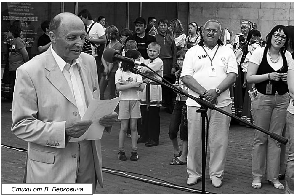
Стихи от Л. Берковича