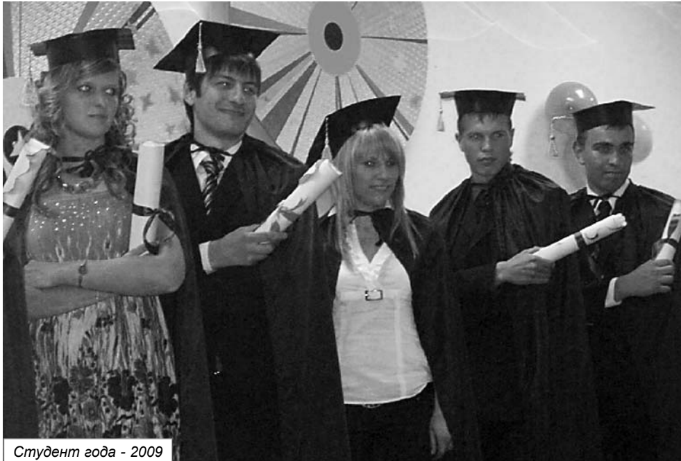
Студент года - 2009

родного класса по стрельбе из лука, серебряный призер чемпионат Европы. Гордость академии - ее школа борьбы,