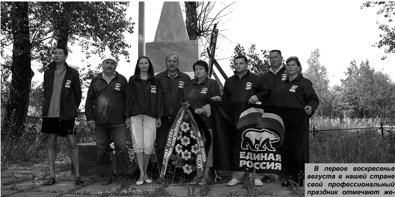
В первое воскресенье августа в нашей стране свой профессиональный праздник отмечают железнодорожники. (Окончание на 2-й стр.)