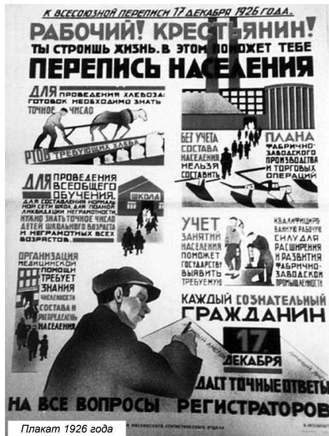
Плакат 1926 года