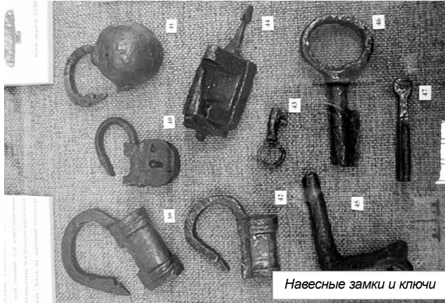
Навесные замки и ключи

И, конечно же, речь зашла о предстоящем 1145-летию первого упоминания Великих Лук в Новгородской летописи. Город гораздо старше этой даты, что признают и результаты, к сожалению, кратких