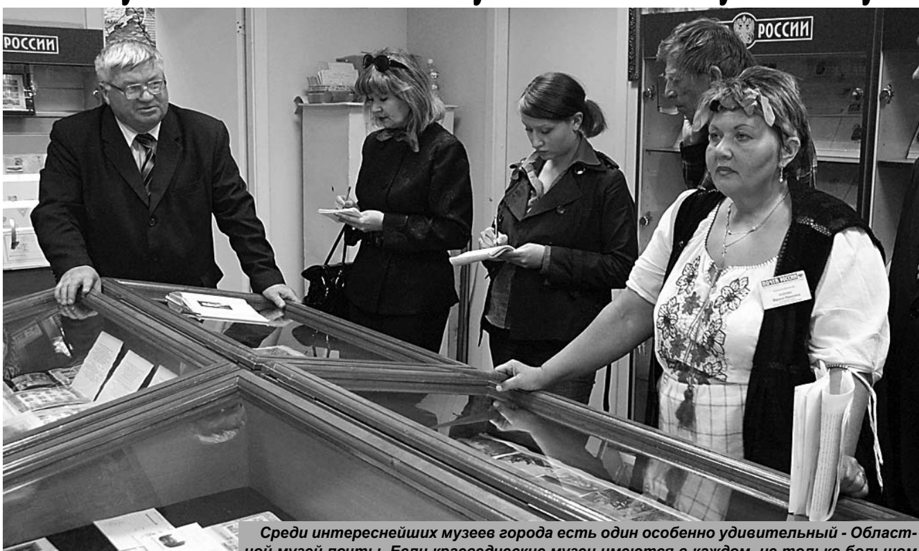
Среди интереснейших музеев города есть один особенно удивительный - Областной музей почты. Если краеведческие музеи имеются в каждом, не только большом городе, но и в каждом провинциальном городке и даже на селе. Но музеев почты по России единицы, но такой, с которым мы познакомимся в Великих Луках уникален. (Окончание на 2-й стр.)