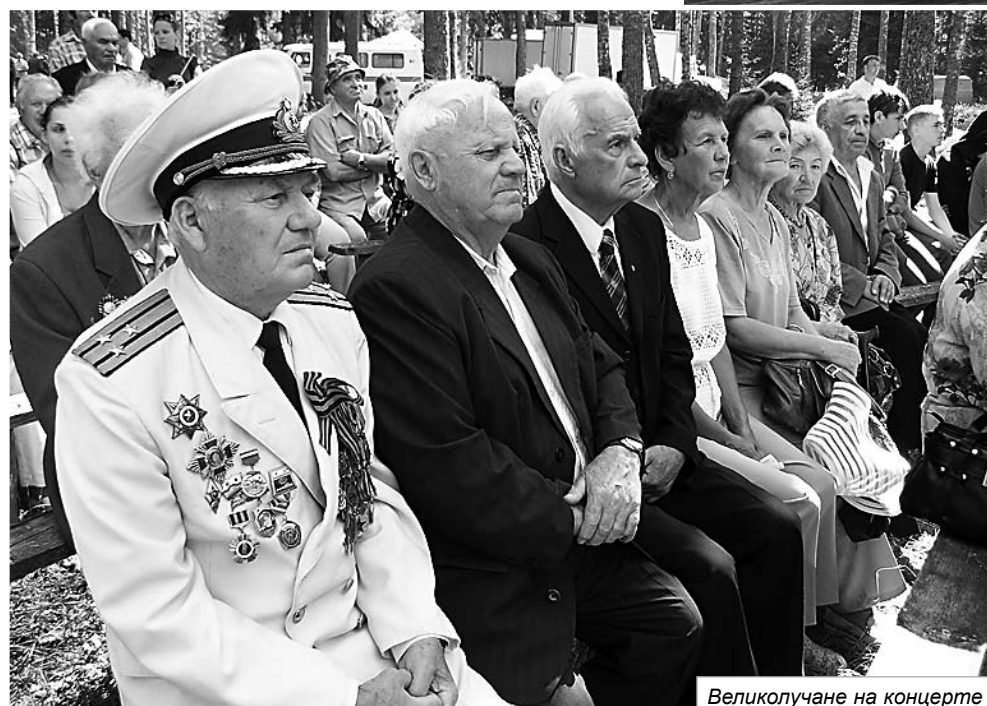
Великолучане на концерте