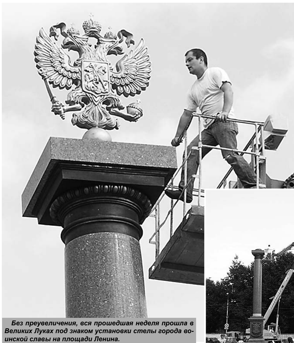
Без преувеличения, вся прошедшая неделя прошла в Великих Луках под знаком установки стелы города воинской славы на площади Ленина.

Мы подробно освещали все этапы монтажных работ, которые проводились специалистами Московского кам-