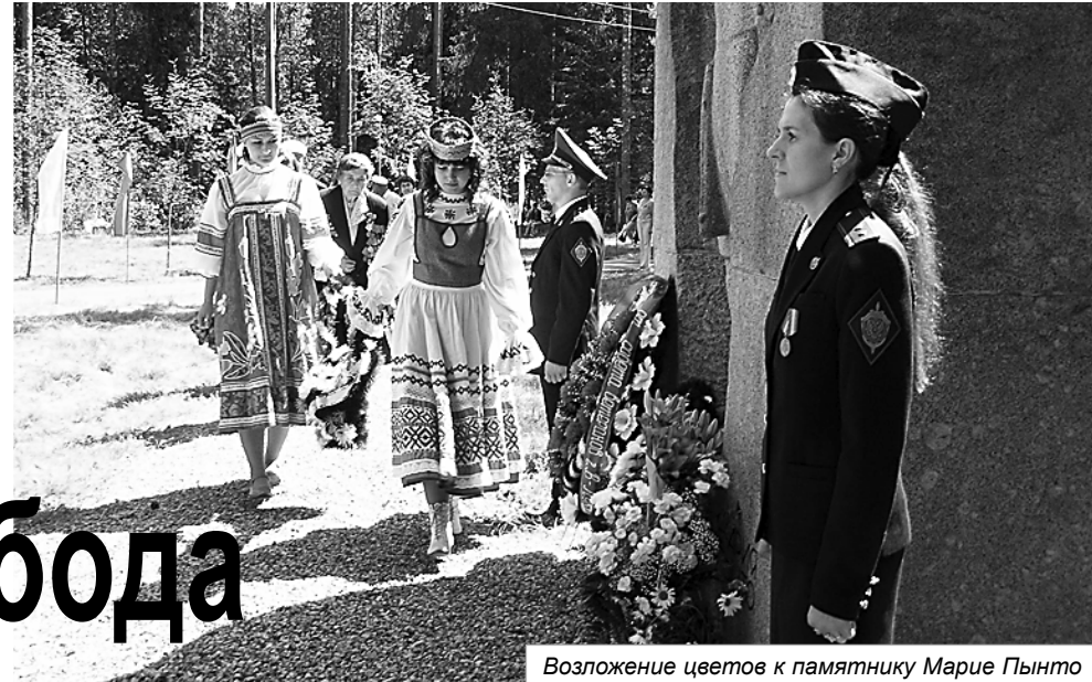
Возложение цветов к памятнику Марии Пынто