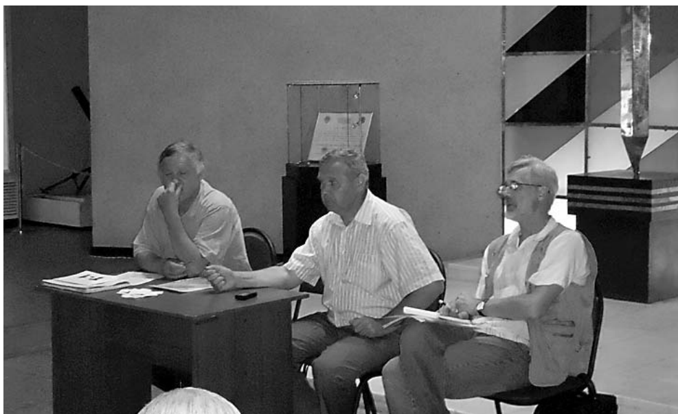
7 июля в помещении краеведческого музея состоялось открытое заседание судейской коллегии по многодневной гонке чемпионата и первенства России, который стартовал из Великих Лук в Пушкинские Горы. Завершится он 11 июля снова в Великих Луках, где и состоится награждение победителей.

ке. Награждение состоится у памятника Александру Мартову.