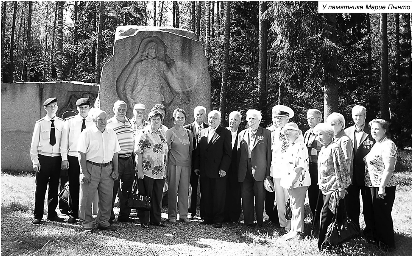
У памятника Марие Пынто