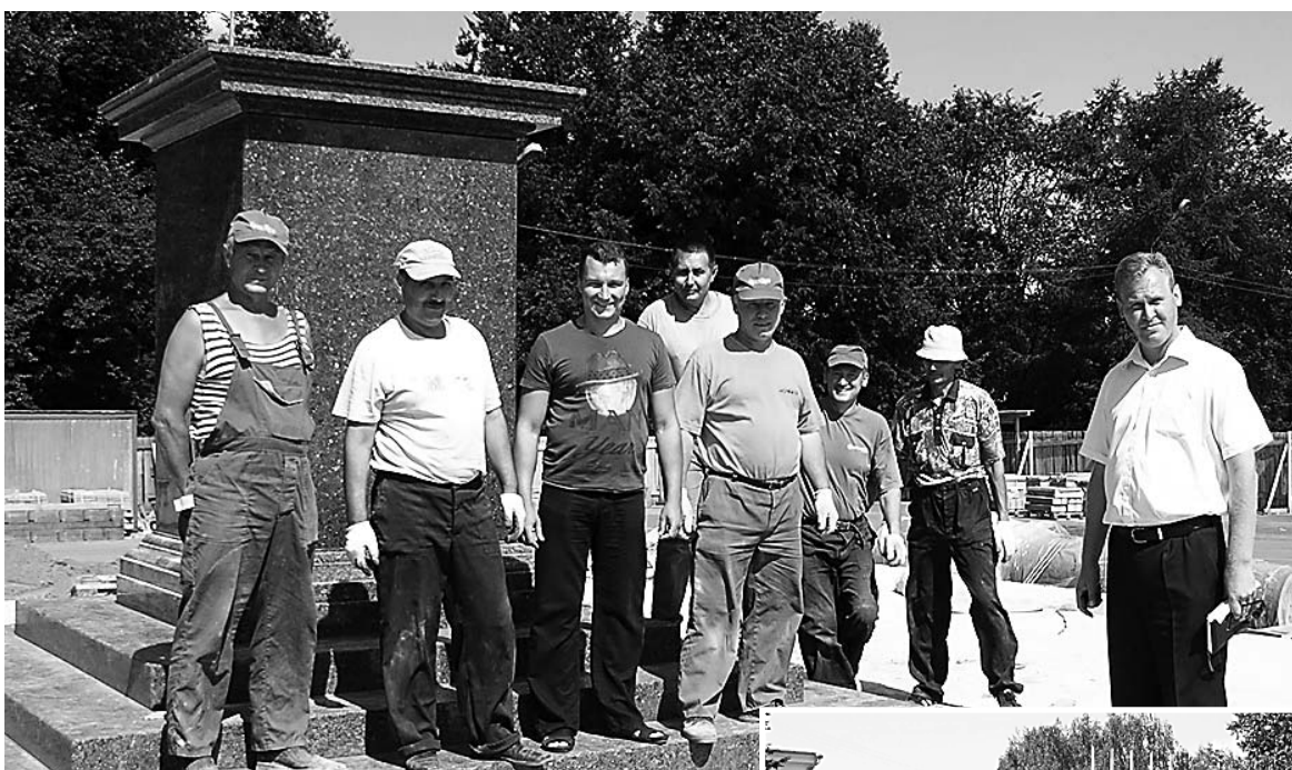
Во вторник, 29 июня, в Великие Луки прибыла монтажная бригада Московского камнеобрабатывающего комбината, где была изготовлена наша стела города воинской славы.