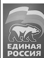
График приема граждан в общественной приемной Партии «Единая Россия»

(ул. Некрасова, д. 10) Прием проводится с 10 до 13 часов и с 14 до 17 часов