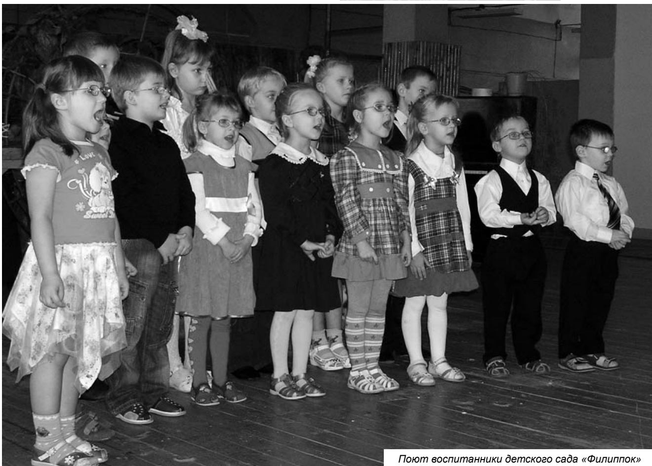
Поют воспитанники детского сада «Филиппок»

- Уважаемые друзья, мы с вами собрались в канун Международного дня инвалидов. В городе Великие Луки традиционно проводится большой