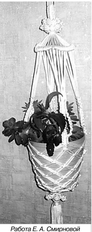
Работа Е. А. Смирновой

резать из дерева красивые вещи, дарить их друзьям и участвовать в выставках.