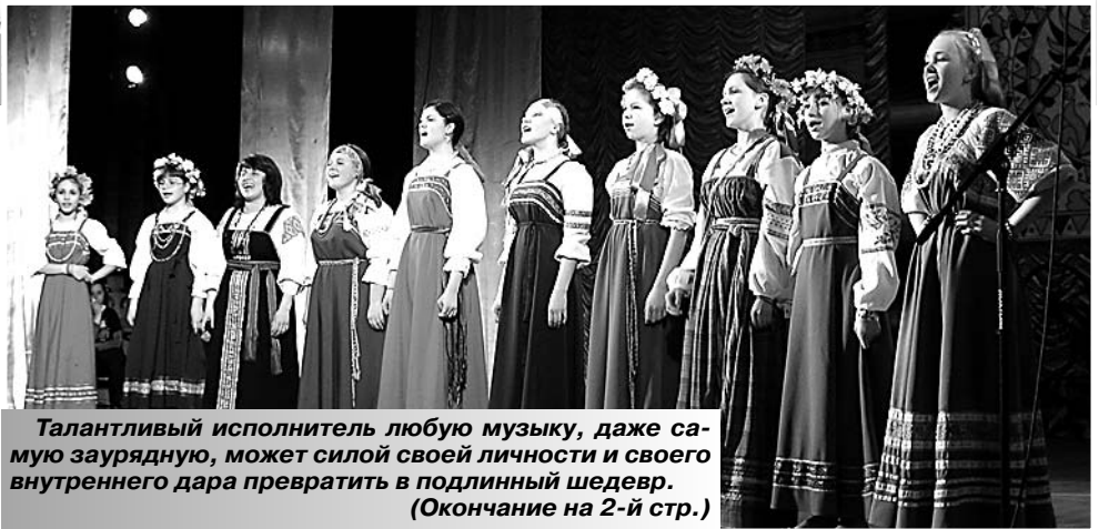
Талантливый исполнитель любую музыку, даже самую заурадную, может силой своей личности и своего внутреннего дара превратить в подлинный шедевр. (Окончание на 2-й стр.)

Довоенное детство Детские годы прошли в Великих Луках, жил с родителями и двумя старшими сестрами недалеко от хлебозавода у речки Лазавицы. Улица там, как и Торопецкая, примечательна тем, что была выложена камнями, то есть мостовая. (Окончание на 3-й стр.)