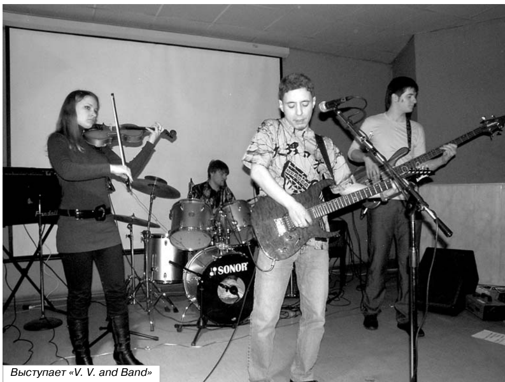
Выступает «V. V. and Band»

Кстати, насчёт этого самого «ня». В японском языке частица «не» ставится в конце предложения и призывает собеседника согласиться с только что сказанным. И трудно бывает не согласиться, когда всё сделано с любовью и улыбкой! Ня? Ня!