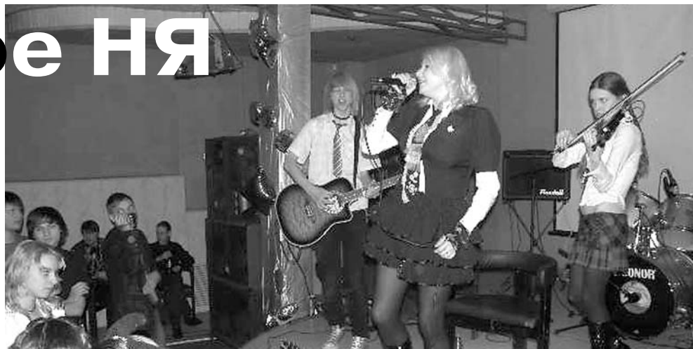
«Himitsu Desu» и в неполном составе вне конкуренции

Вместе с радующейся публикой у сцены лихо отплясывали, до того, как сами