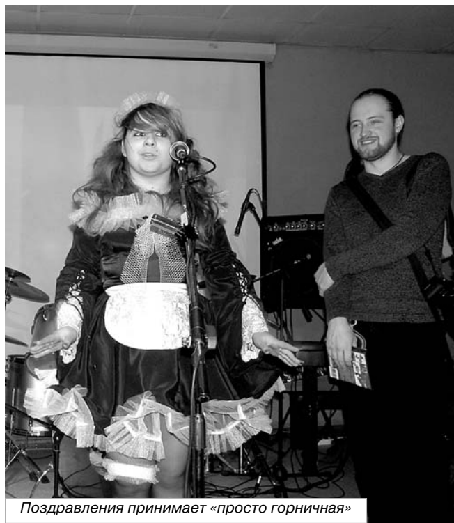
Поздравления принимает «просто горничная»

В это трудно поверить, но вот она - живая сила сметающего всё вокруг интереса: можно иметь посредственные школьные оценки по иностранному языку, и назубок с экрана с лёгкостью запоминать японские фразочки типа «Chotto matte» («Немного подождите») или «Kanarazu» («Клянусь, что всё выполню»). Нужно было видеть реакцию почти сотни молодых людей, с явным преобладанием верных поклонников аниме - отaku, когда начало вечера открылось