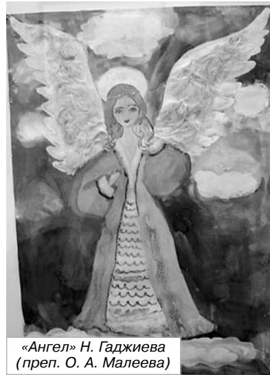
«Ангел» Н. Гаджиева (преп. О. А. Малеева)