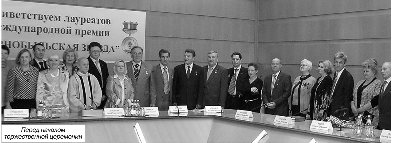
Перед началом торжественной церемонии

И вот, наконец, ведущей торжественной церемонии