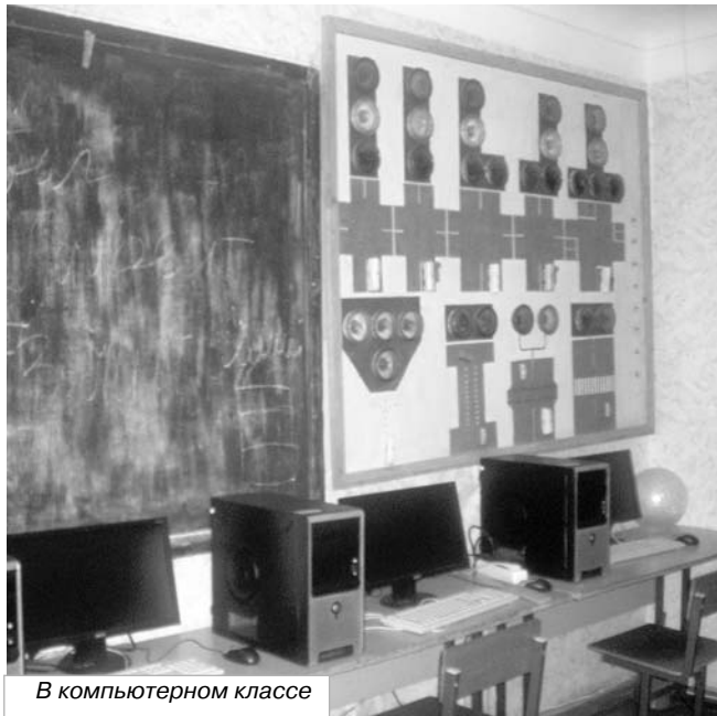
В компьютерном классе