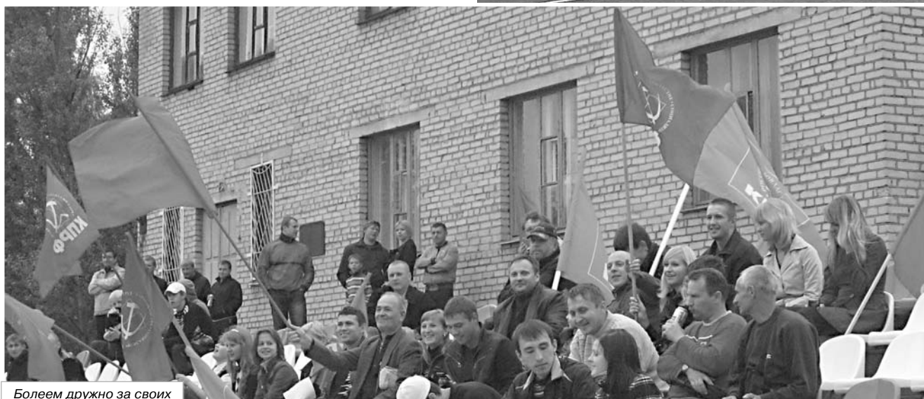
Более дружно за своих