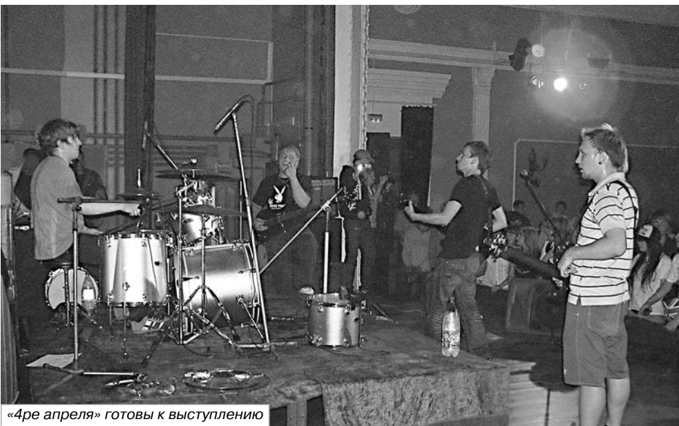
«4ре апреля» готовы к выступлению

Тем не менее свою программу ребята отыграли в высшей степени задорно и с большим желанием наладить контакт с аудиторией. На заключительной композиции «Война» зал уже настолько свыкся с заводным панк-роком на основе смеси трэша и гранжа, что не хотел отпускать ребят, где-то с минуту скандируя название группы.