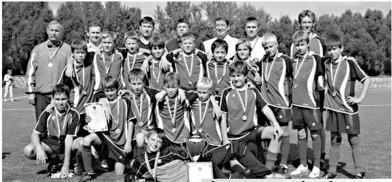
Завершилось первенство Северо-Западного региона среди футболистов 1996 года рождения, которое проходило на великолукском стадионе «Экспресс» с 18 по 22 августа 2009 года.