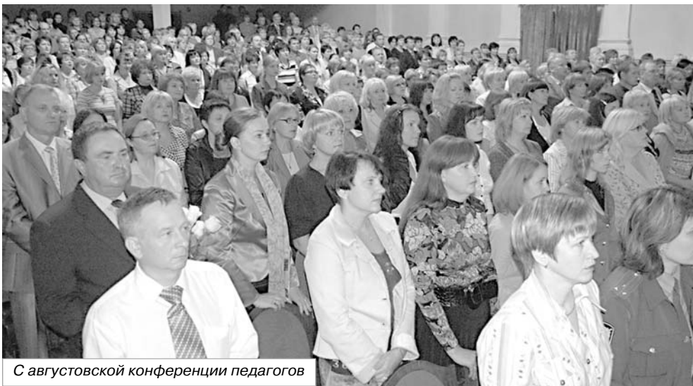
С августовской конференции педагогов