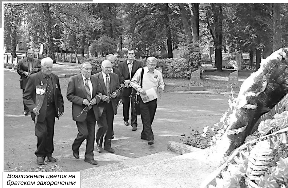
Возложение цветов на братском захоронении