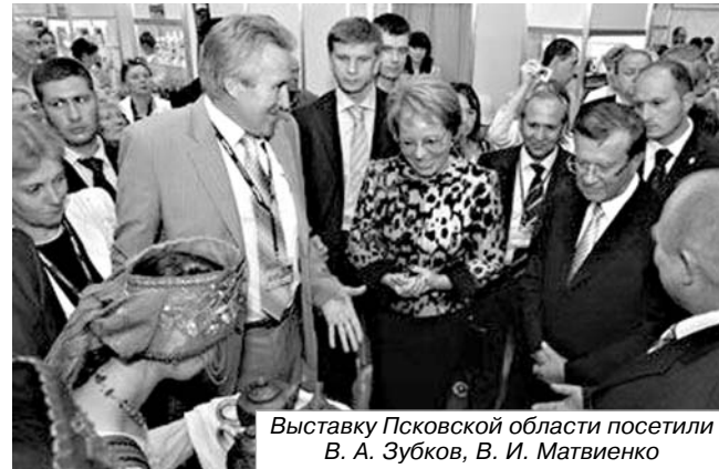
Выставку Псковской области посетили В. А. Зубков, В. И. Матвиенко

тый» первым на территории области взял кредит по национальному проекту «Развитие АПК». Благодаря нацпроекту «Развитие АПК» предприятие обновило материально-техническую базу, что позволило активно внедрять ресурсосберегающие технологии и значительно улучшить качество производимой продукции. В настоящее время «Шелонский» выпускает около 100 наименований мясных изделий из свежего мяса: от сосисок и сарделек, мясных консервов, копченостей, полуфабрикатов до вареных и полукопченых колбас, которые пользуются спросом не