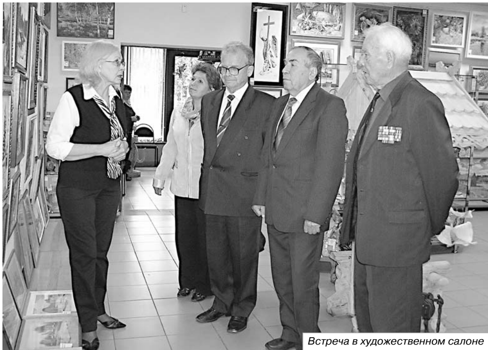
Встреча в художественном салоне