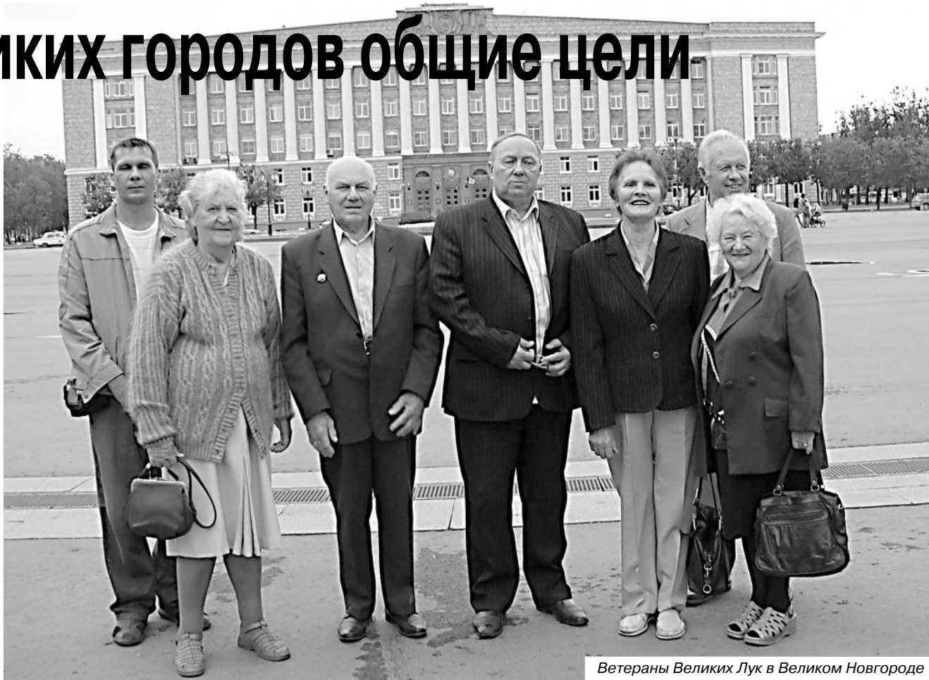
Ветераны Великих Лук в Великом Новгороде