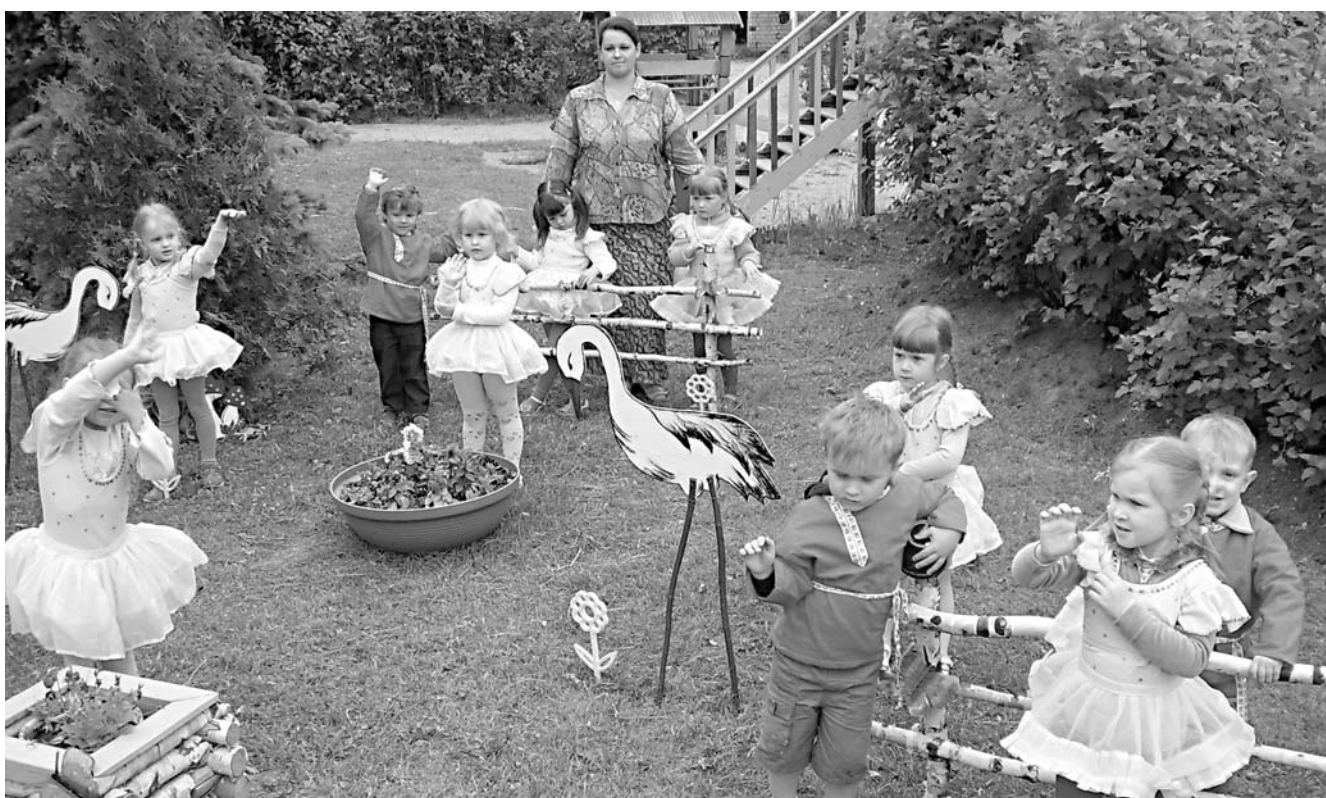
Администрация и педагогический коллектив детского сада «Росинка» делают все возможное для обеспечения физического и психического благополучия детей. Ведь развитие художественных интересов, творческой фантазии, физических способностей начинается в раннем детстве. (Окончание на 3-й стр.)