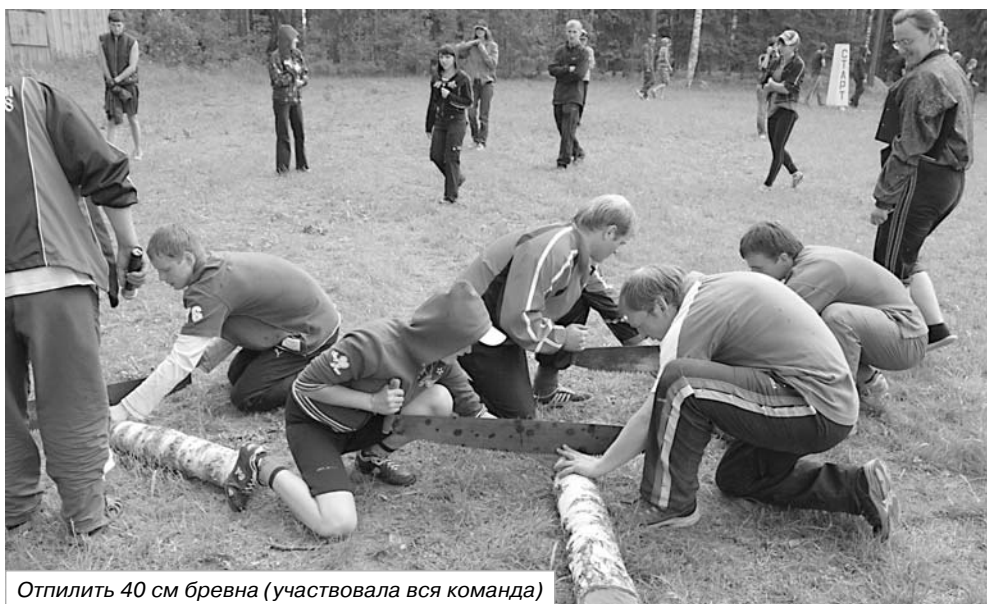
Отпилить 40 см бревна (участвовала вся команда)

ресной и увлекательной может быть вузовская жизнь настоящих и вновь приходящих студентов. Множество