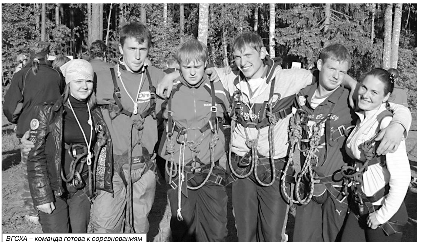
ВГСХА – команда готова к соревнованиям

«А еще жизнь прекрасна потому, что можно путешествовать»