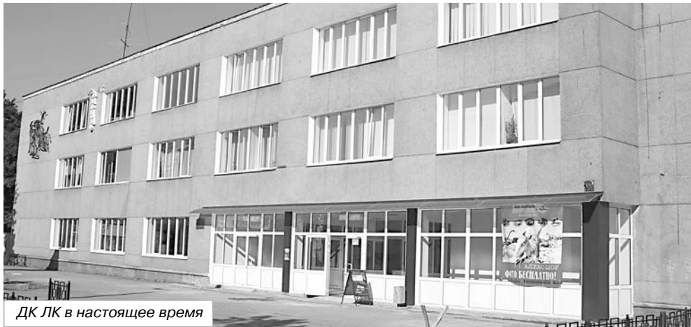
ДК ЛК в настоящее время

(Окончание. Начало на 1-й стр.) - Значит, ремонт может превратиться в долготрой?