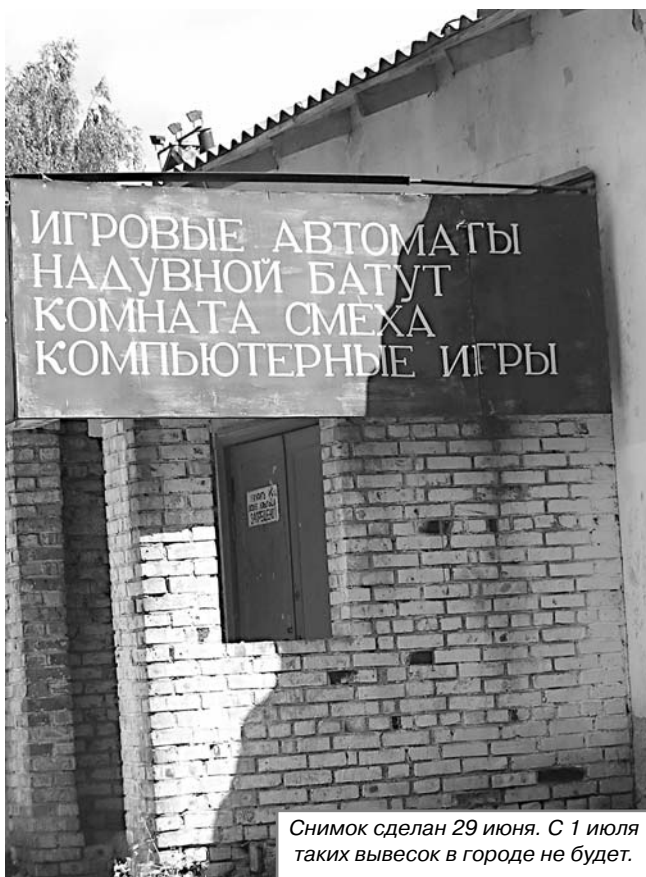
Снимок сделан 29 июня. С 1 июля таких вывесок в городе не будет.

Великих Лук приходится 3 фирмы, из которых одна - «Ной» - имеет 6 автоматов, но они не подключены и не работают. (Окончание на 2-й стр.)