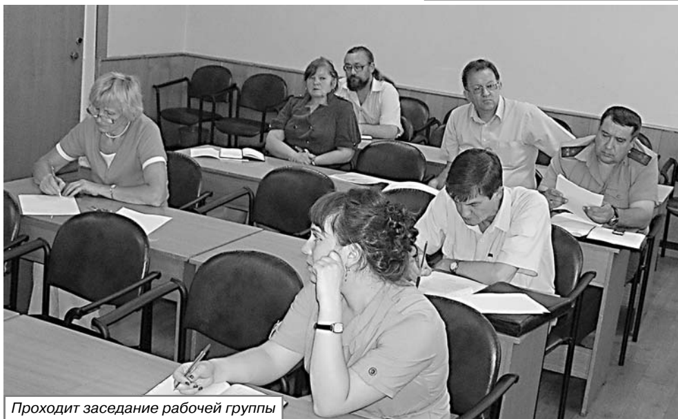
Проходит заседание рабочей группы

Великих Лук приходится 3 фирмы, из которых одна - «Ной» - имеет 6 автоматов, но они не подключены и не работают. (Окончание на 2-й стр.)