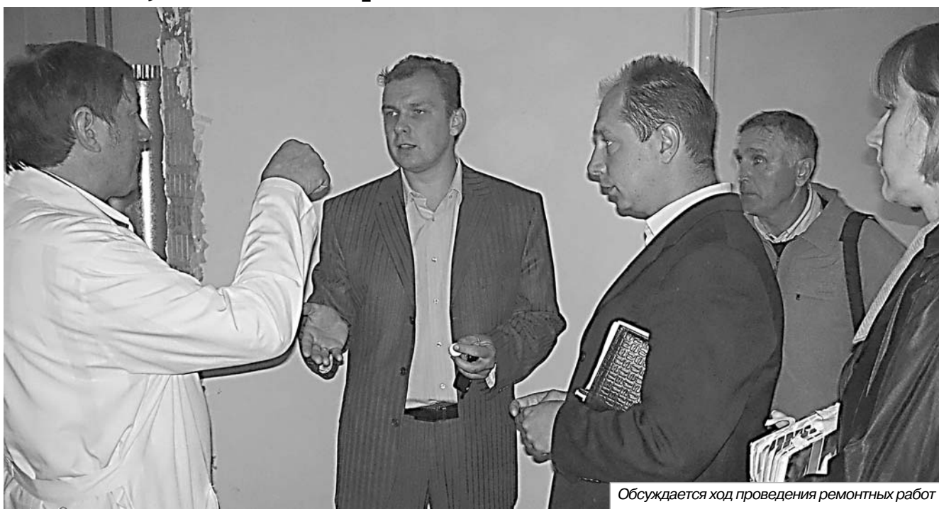
Обсуждается ход проведения ремонтных работ

Я не побоюсь сказать, что это главный дом, в котором все мы были. Это храм, в котором человек появляется на свет, в котором происходит таинство деторождения.