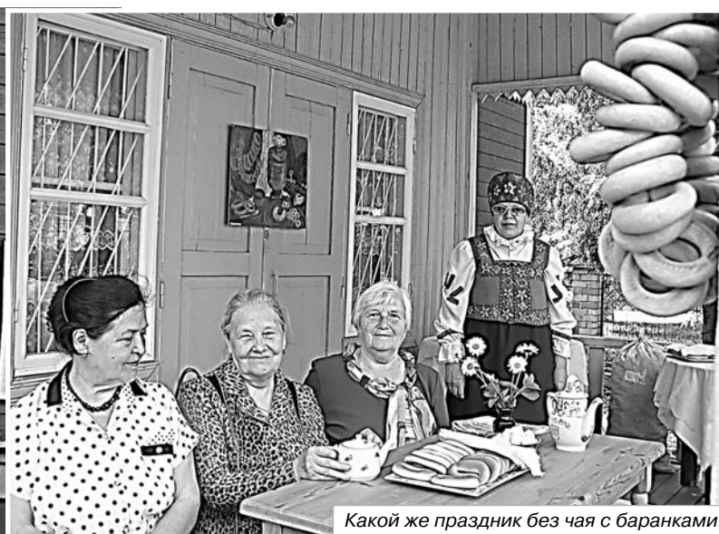
Какой же праздник без чая с баранками!

День России в Великих Луках, может быть, проходил не столь официально и торжественно, как в областном центре, как в Изборске и на Святом Холме, но горожане ничуть не остались в стороне от государственного праздника. Наполняя его местным колоритом и своим, только Великим Лукам присущим, содержанием.