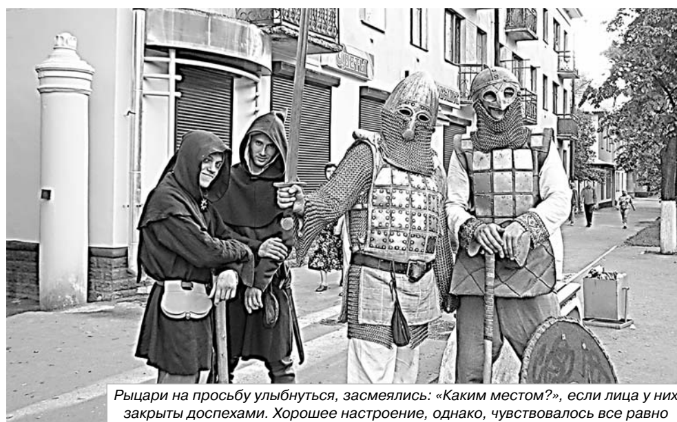
Рыцари на просьбу улыбнуться, засмеялись: «Каким местом?», если лица у них закрыты доспехами. Хорошее настроение, однако, чувствовалось все равно

бы любить Россию, нужно вначале полюбить то, из чего понятие «Россия» состоит. А Великие Луки сейчас – это еще и воздухоплавание. Это та частичка, которую Ве-