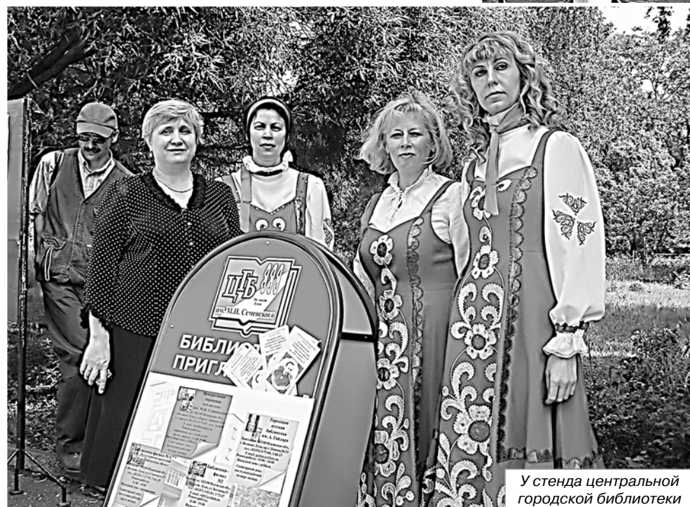
У стенда центральной городской библиотеки