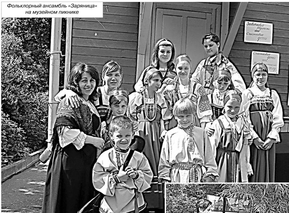
Фольклорный ансамбль «Заряница» на музейном пикнике