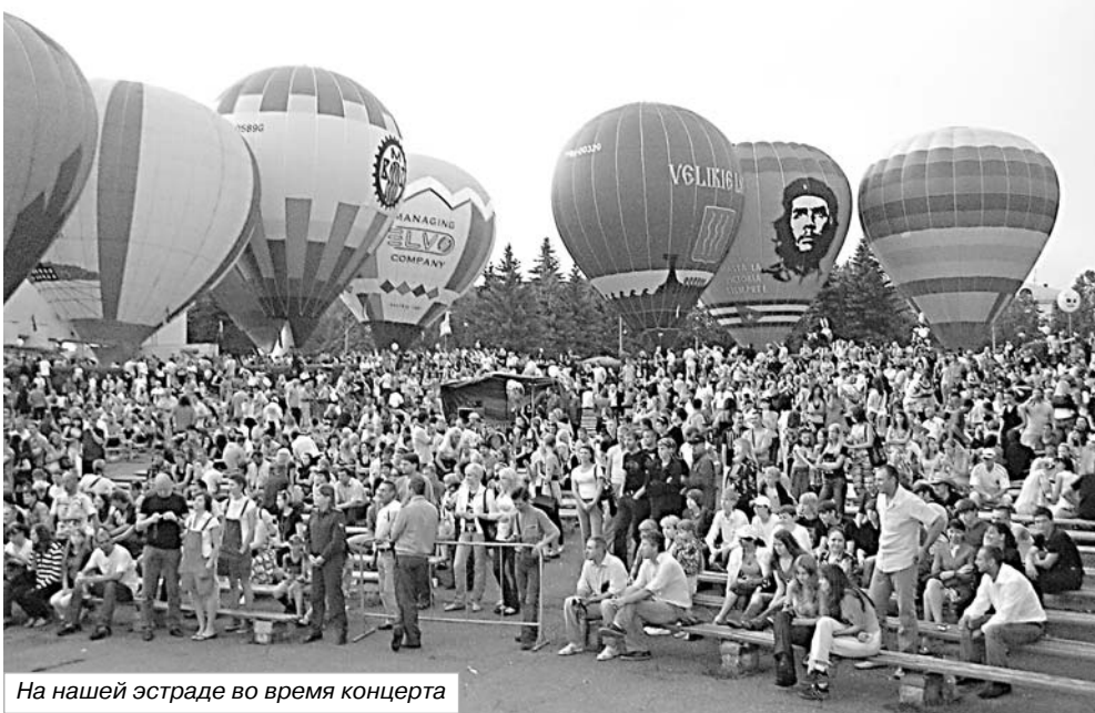
На нашей эстраде во время концерта