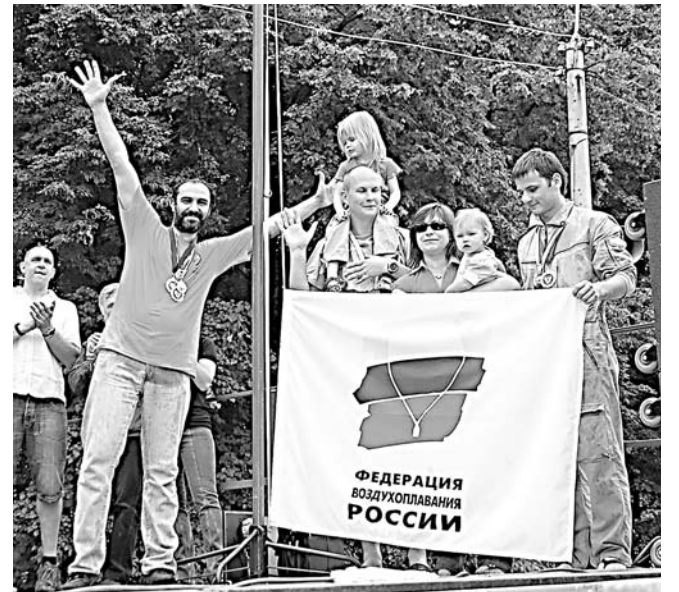
Флаг соревнований спущен