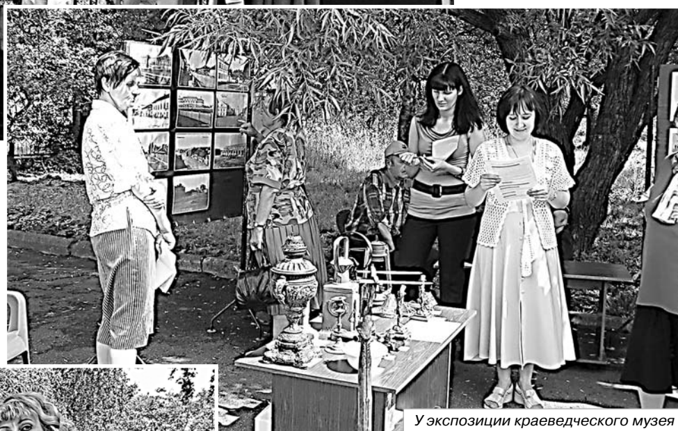
У экспозиции краеведческого музея

ральной библиотеки. На террасе дома-музея был накрыт стол для чаепития. Общей идеей мероприятия был показ истории и современности страны через судьбы конкретных людей, живущих в конкретном городе. Ведь что-