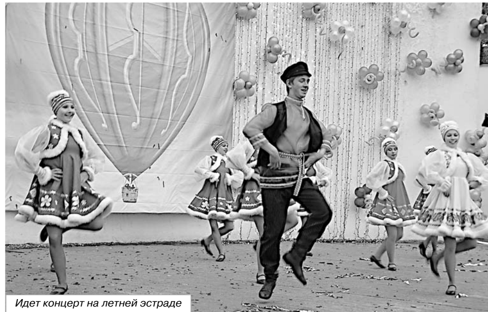
Идет концерт на летней эстраде

от себя лично, от лица Администрации Псковской области поздравить вас с Днем города, города, который по праву является нашей южной столицей. Не столько по своему географическому и экономическому положению, сколько по тем людям, которые в нем живут. На самом деле в нашей необъятной стране есть всего четыре великих города. Это Великий Новгород, Великий Устюг, Ростов Великий и Великие Луки - наверное, наш самый любимый с вами город.