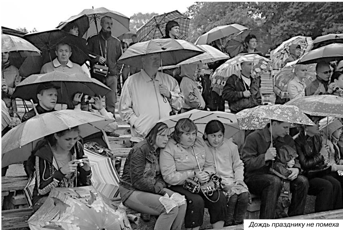
Дождь празднику не помеха

возможности, будем признательны и тем, кто имел возможность помочь, но не помог. Мы всегда готовы к сотрудничеству.