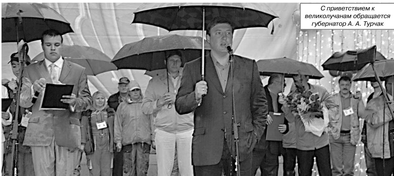
С приветствием к великолучанам обращается губернатор А. А. Турчак