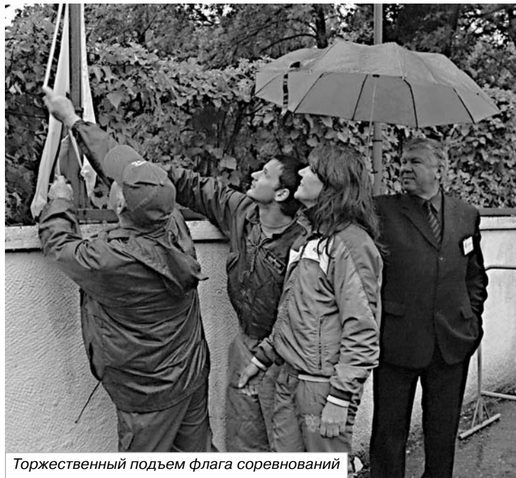
Торжественный подъем флага соревнований