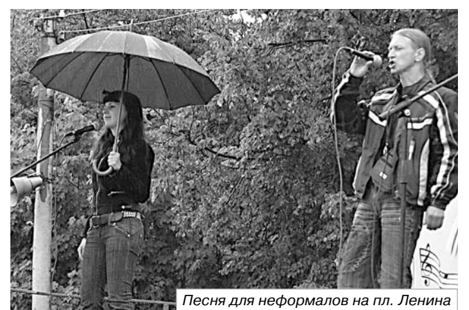
Песня для неформалов на пл. Ленина