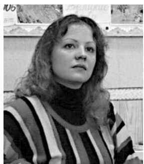
И там, где ветер – гуляка весёлый

Там, где в нектаре купаются пчёлы, Там, где дурманит сирень.